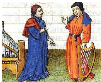
France, XV e siècle, Un compositeur et musicien bourguignon

Ce concert tentera de donner un aperçu de la vie musicale à la cour de Bourgogne à son apogée en mettant en avant les trois compositeurs les plus célèbres attachés à Charles le Téméraire : Antoine Busnoys, Robert Morton et Hayne van Ghizeghem. La présence d'un seul de ces hommes, qui ont chacun joui d'une réputation internationale, aurait suffi à élever la qualité artistique de la cour à un niveau remarquable : les trois regroupés, dans le même contexte princier, ont littéralement marqué l'histoire musicale européenne.